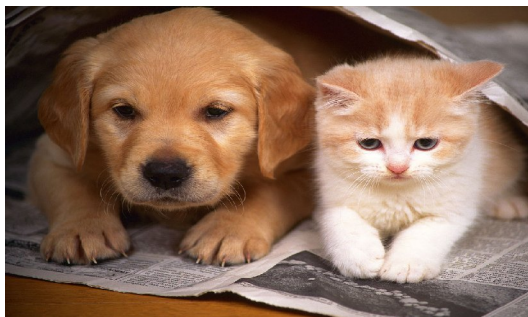
Faça o Registo do seu cão e gato!

Estes serviços visam uma maior proximidade entre a união das freguesias e a população.